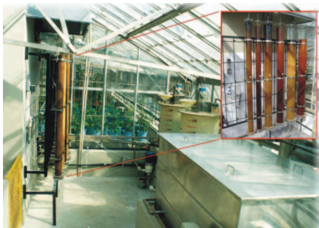
Figura 5. Central de purificação de água para uso em laboratórios, empregando a técnica de desionização através de resinas de troca iônica, seguida de esterilização UV

suprindo as necessidades da Instituição, fornecendo água de excelente qualidade (condutividade = 0,2 a 1 \mu\text{S cm}^{-1} ; pH = 6,5 a 7,5) para uso nos laboratórios da Instituição, resultando em economia nos consumos de água e energia, é ilustrado na Figura 5.