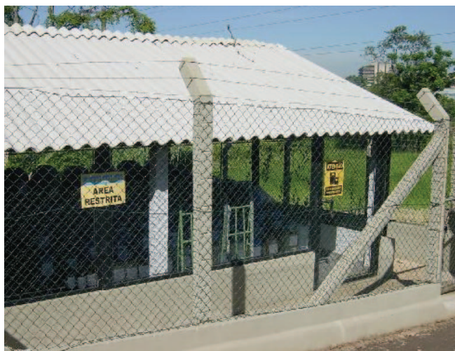
Figura 3. Depósito temporário para armazenamento de resíduos líquidos e sólidos no CENA/USP

mentos simples de tratamento de resíduos, dados sobre uso adequado de EPI's e EPC's, entre outros. Entretanto, destaca-se a elaboração de um campo para envio de ordem de serviço, que permite ao usuário (docente, discente ou servidor de algum laboratório da Instituição) solicitar a retirada de um ou mais volumes de resíduos de seus laboratórios, ou qualquer outra informação pertinente. O desenvolvimento de um software para o controle de estoque dos volumes de resíduos armazenados no depósito, que possibilita a fiel identificação da disposição temporária desses materiais, bem como a elaboração de relatórios das atividades de entrada ou saída de resíduos num dado período, merece igual destaque.