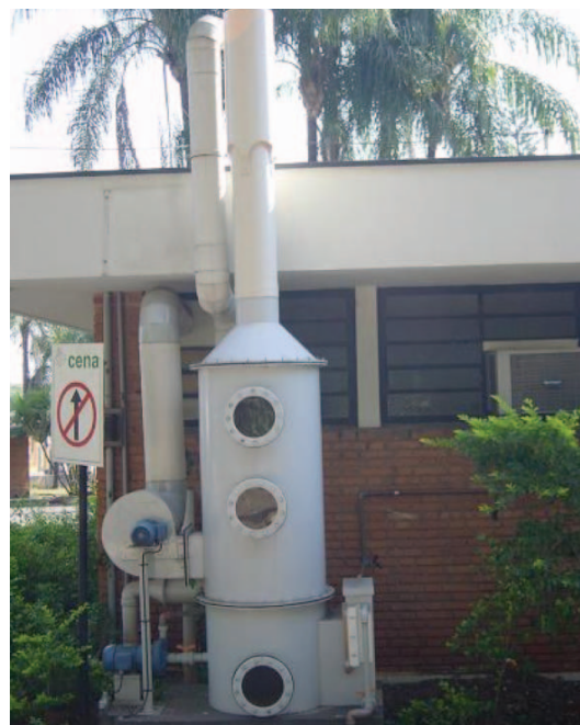
Figura 4. Lavador de gases para vapores ácidos, acoplado à capela instalada no laboratório de Nutrição Mineral de Plantas do CENA/USP

Ao mesmo tempo, em um processo desenvolvido para síntese de uréia enriquecida no isótopo 15 N, são gerados em rotina cerca de 1,2 kg de ácido sulfídrico, que é um gás extremamente tóxico 16 . Esse gás está sendo tratado através da sua oxidação à sulfato, em meio alcalino, na presença de peróxido de hidrogênio. Uma outra