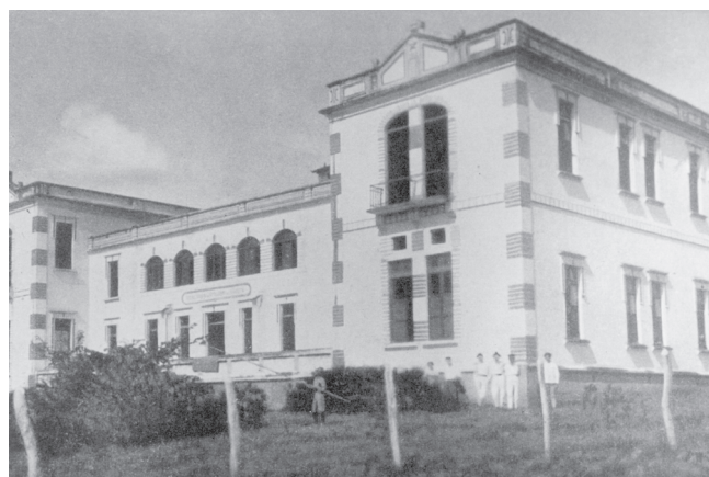
Figura 3. Prédio onde funcionou o Curso Superior de Agricultura “São Bento” em Tapera, atualmente inundado pelas águas da Represa do Rio Tapacurá. Foto retirada do álbum das “Escolas Superiores de Agricultura e Medicina Veterinária - 1913-1923. Friburgo/Alemanha: Tipographia Herder & Cia, 1923