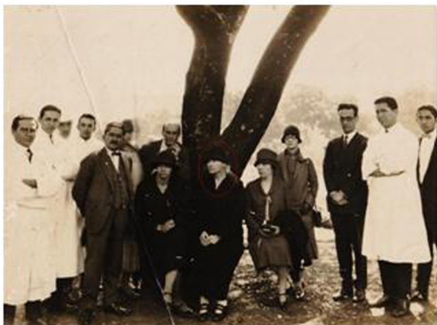
Figura 1. Visita de Madame Curie ao Instituto do Radium em 1926

A presença de Marie Sklodowska Curie em Belo Horizonte foi documentada numa foto, como na Figura 1, tirada em frente ao Instituto do Radium de Belo Horizonte, atualmente pertencente ao Hospital das Clínicas da UFMG.