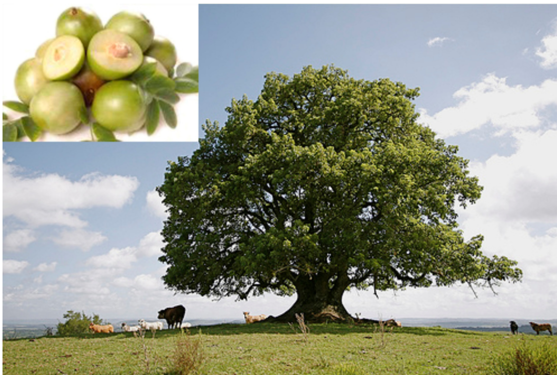
Figura 3S. Fotos de um umbuzeiro e seus frutos.