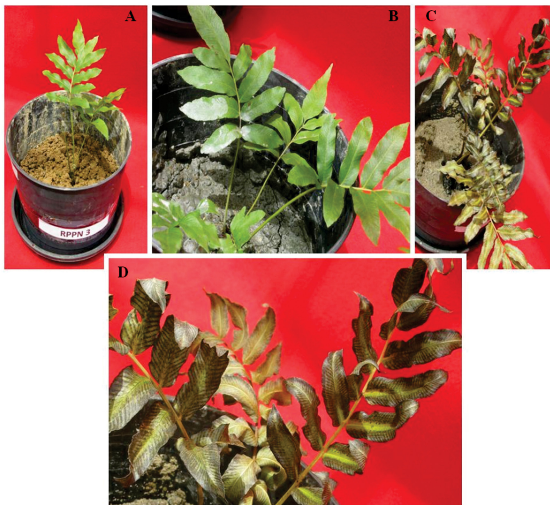
Figura 1S. Thelypteris salzmannii após cinco dias de transplantio em substratos contaminados provenientes de áreas de mineração de ouro localizada em Paracatu – MG. A) Substrato RPPN; B) Substrato B1; C) Substrato Rejeito + Areia (1:2); D) Detalhe dos frondes com sintomas de fitotoxidez no substrato Rejeito + Areia (1:2)

Apresenta imagens das espécies de pteridófitas Thelypteris salzmannii e Dicranopteris flexuosa . Sintomas de fitotoxidez podem ser observados após a exposição dessas espécies às diferentes concentrações de arsênio no solo proveniente de uma área impactada pela mineração de ouro em Paracatu - MG